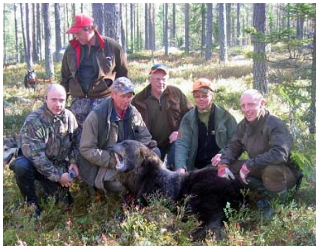
Lyckad björnjakt med nöjda gästjägare

På kvällarna brukar Jaktguiden ta med jaktgästerna på rekognosering inför kommande dag om så önskas. Gästerna välkomnas till Norrigården av deras personliga guider.