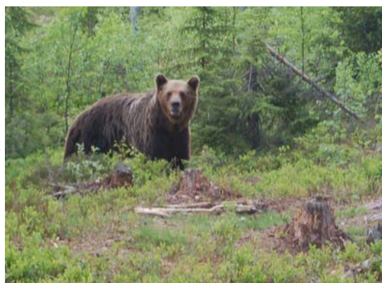
Beer in natuurlijke omgeving

Neem contact op met Norrigården voor de exacte prijzen voor uw specificatie.