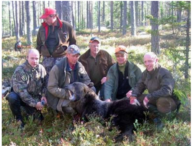
Geslaagde berenjacht met tevreden gastjagers

Berenjacht in een gebied waar de berenstam groter en groter wordt. Onze omgeving is deel van het kerngebied van de berenstam. Twee gastjagers kunnen met een hondenbegeleider met goede honden mee jagen. Dit wordt gecombineerd met het wachthouden in de jachttorens en het observeren van beren bij bepaalde plaatsen. s'Avonds nemen de jachtleiders hun gasten vaak mee om indien gewenst, al voor de volgende dag naar wild te speuren. De gasten worden op Norrigården opgevangen door hun persoonlijke jachtleiders en ontvangentevens een leuk welkomstkado.